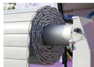
Pied + bouton à clé