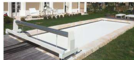
Structure et tablier