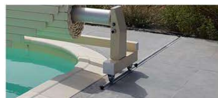
Pied + bouton à clé + rail