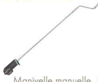
Manivelle manuelle démultipliée