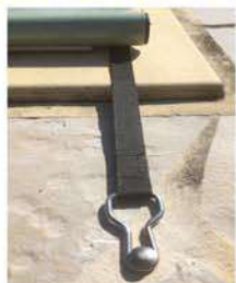
Sangles avec boucle