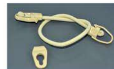
Sandow V avec plaquette (selon la forme de la bâche)