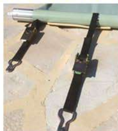
Cliquets avec boucles